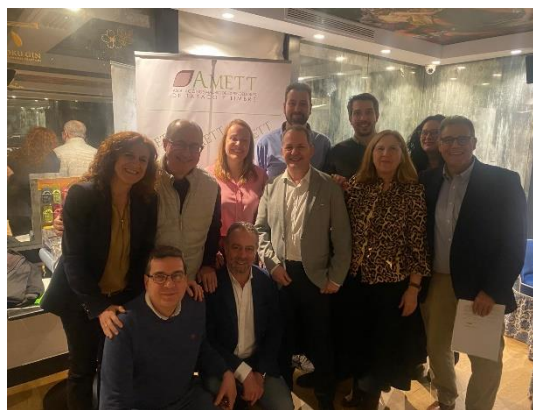
A la izquierda los miembros de la Junta Directiva junto con el personal de AMETT a la finalización de la reunión.