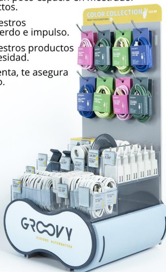
EXPOSITOR PAINT Venta de cables y accesorios para móviles. Medidas: 29x56x0,5 cm.