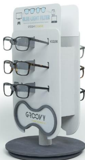
EXPOSITOR OPTIC Venta de gafas con filtro de luz azul. Protege tus ojos de la luz que emiten tus dispositivos Medidas 25x40,5x25 cm.