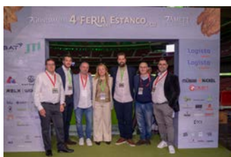
JUNTA DIRECTIVA AMETT