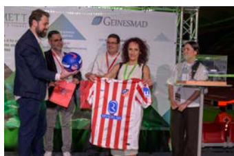
SORTEO DE REGALOS

PUEDES ACCEDER A TODAS LAS FOTOS DE LA FERIA HACIENDO CLICK AQUÍ